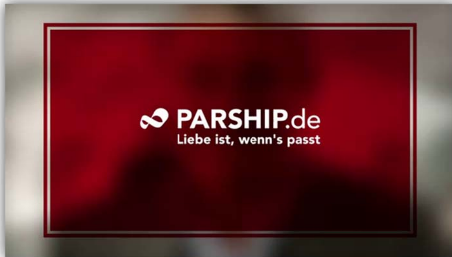
Abb. 1: Werbespot Parship

Hier ist ein Screenshot aus einem Werbefilm Parship, einer der führenden Partnervermittlungsagenturen im Netz. Ihr Slogan „Liebe ist, wenn’s passt“, bringt eines der zentralen Versprechen des neuen Mediums auf den Punkt. Immer wieder betonen die Anbieter von Online Dating Seiten, dass erst eine optimierte ‚Passung‘ zwischen den zukünftigen Partnerinnen oder Partnern eine langfristig glückliche Beziehung gewährleisten könne.